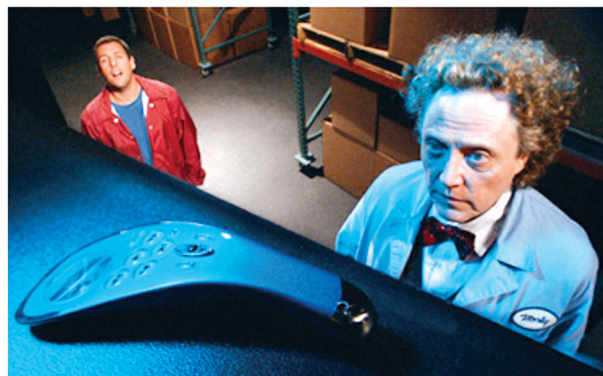
Christopher Walken (right) and Adam Sandler get ready to Click

人一生的幸福快樂，並不是來自於財富和權力。再引述「素食你我牠」中的一段說明：人腦